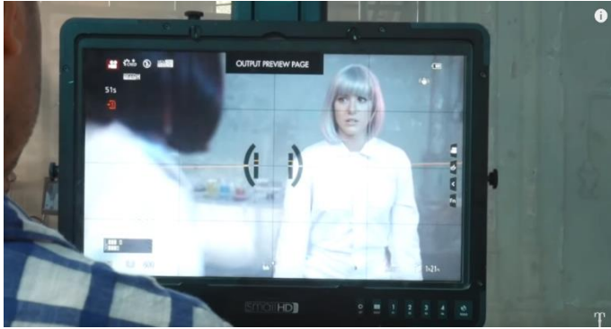
Behind the scenes bij het opnemen van een videoclip Teske videoclip opnemen (Bron: Youtube, Teske).