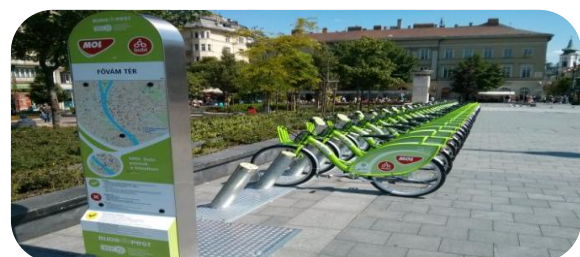
Figuur 1 Illustratie M-Bike station

Naast de directe buslijn willen we de Duitse studenten de optie bieden om gebruik te maken van de OV-fiets (De M-Bike!). Deze herkenbare rood-wit gekleurde fietsen zorgen ervoor dat de doelgroep niet enkel afhankelijk is van de directe buslijn. Dit kan aan de hand worden gedaan van het al bestaande NextBike-concept, dat nu al gebruikt wordt in meer dan 70 steden in zestien verschillende landen. Maastricht kan een pioniersrol voor deze formule in Nederland vervullen. We stellen voor M-Bike gefaseerd te integreren, met een tiental inleverstations, namelijk de P+R-gebieden, de kennisinstellingen, het centrum, en het hoofdstation. De M-Bike kan worden ingeleverd in de daarvoor afgestelde fietsenrekken. Wanneer de fiets binnen een halfuur bij een inleverstations ingeleverd wordt, wordt er geen geld in rekening gebracht. Ideaal voor studenten, aangezien alle stations binnen een halfuur te bereiken zijn. De M-Bike sluit daarnaast goed aan bij de ingezette beleidskoers ( Versnellingsagenda ) van de Gemeente Maastricht omtrent fietsgebruik.